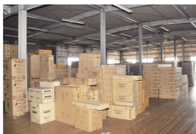
◀もともと家具の運送会社ですので、家具・家財の取り扱いは万全です。遺品の一時保管も可能です。

ます。また遺品整理を法令遵守、円滑に行うために廃棄物処理のために廃棄物事業所、不動産の売却・リフォームのため不動産業、遺言サポートのため行政書士事務所とタイアップしております。 遺品整理士の役目とは単に遺品を分別するだけではなく「ご遺族が知らなかった故人の人の柄や思いをご遺族にお伝えする」大切な役目も担っていると思われました。 取材/宮地 秀一